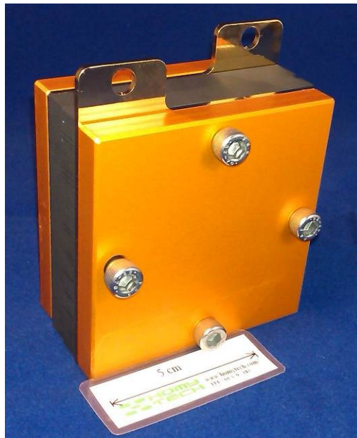
圖一：強固型單電池外觀